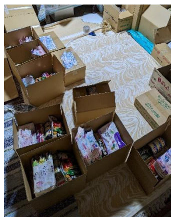
応援の品送付作業